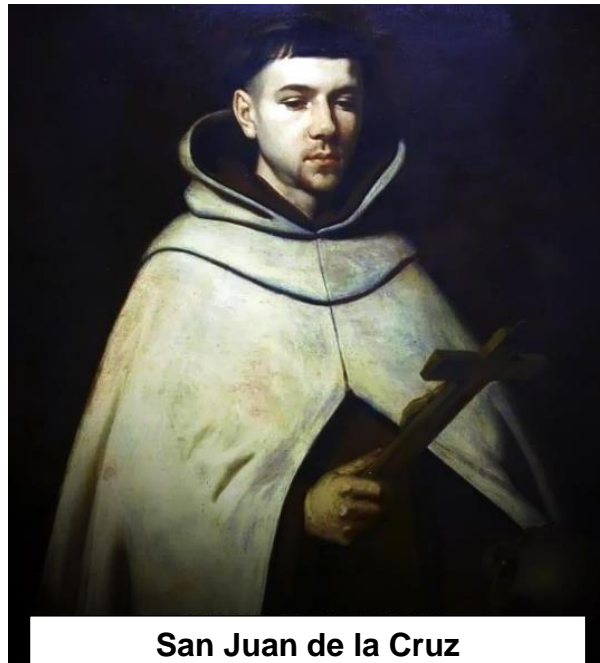
San Juan de la Cruz