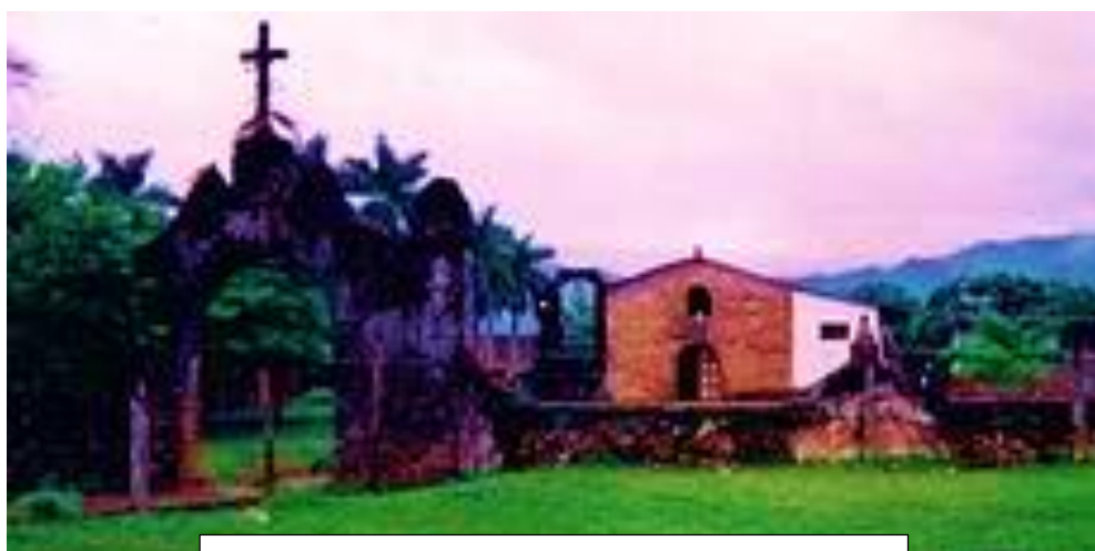
Capilla de San Juan Bautista

Hablamos de una escultura religiosa que tan arraigada está en esta tierra y aunque pasan los años continúa muy presente en su gente y en su memoria.