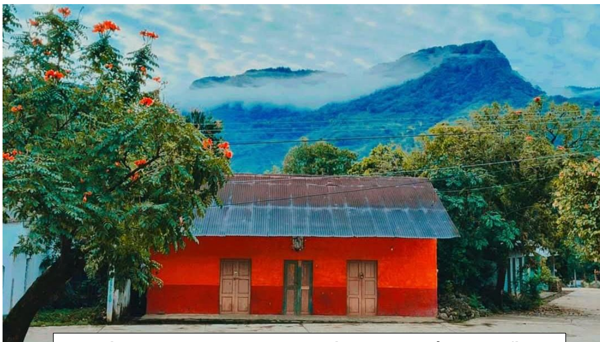
Anterior casa donde veneraban la imagen los días de su fiesta (Casa de Don Samuel Ruiz)