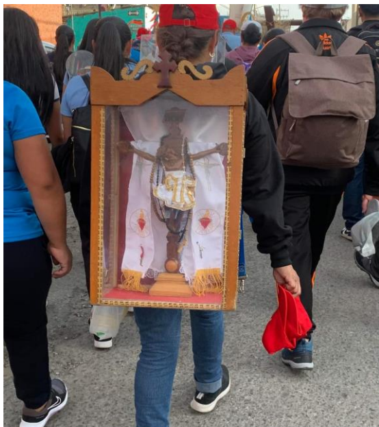
Así de similar era como traían la imagen de San Juan Bautista por las comunidades.

La figura es pequeña, aproximadamente como de 30 centímetros, es una escultura de madera, quien tiene oportunidad de verla dirá que sus características corresponden a una imagen de San Juan Bautista.