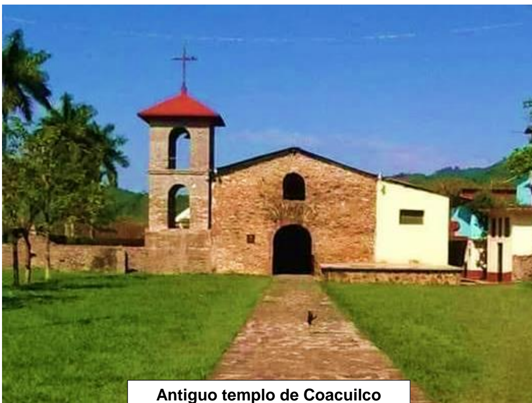
Antiguo templo de Coacuilco