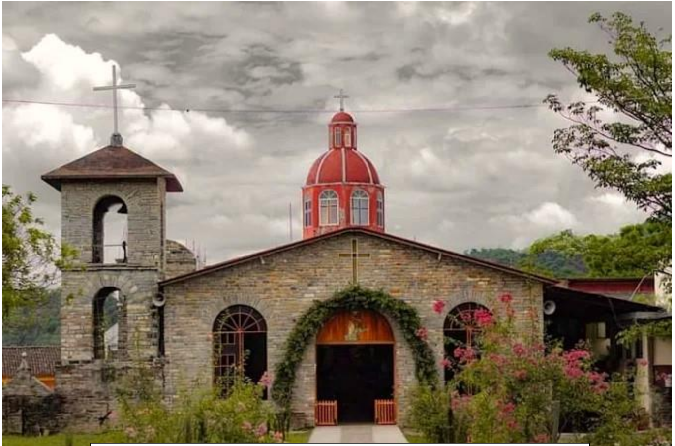
¡COACUILCO, RINCONCITO ENCANTADOR DE LA HUASTECA!