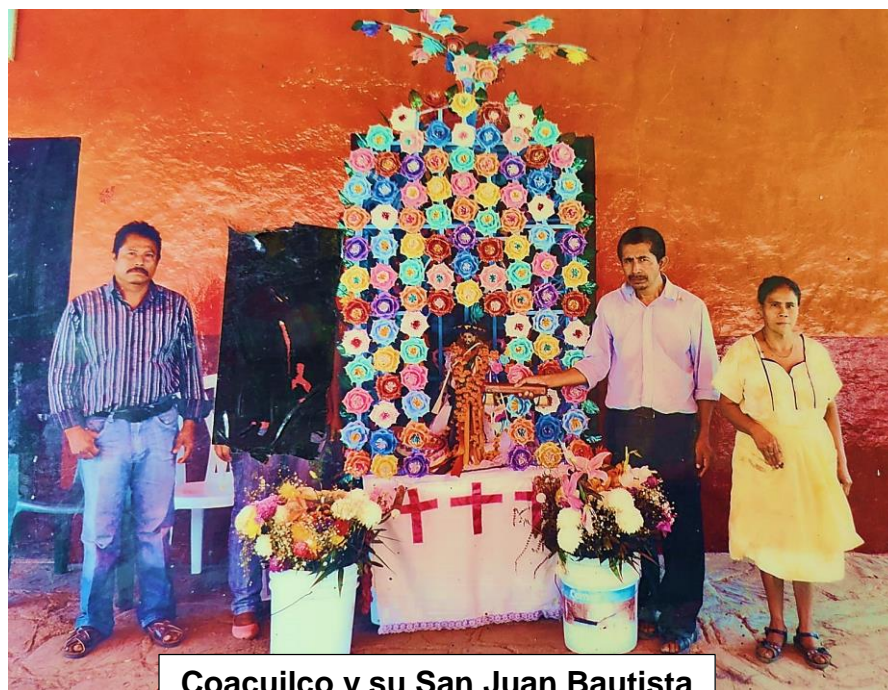
Coacuilco y su San Juan Bautista

Más aun visten a la imagen, le colocan ropa, pero es una ropa inapropiada la que le han colocado, pues lo visten con un atuendo que más que parezca una túnica de pelo de camello, parece ser un vestido femenino, por el corte y lo amplio de la falda.