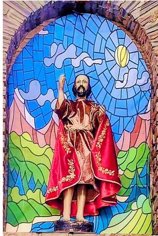
Escultura de San Juan Bautista que se encuentra en la Parroquia