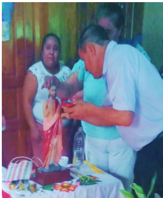
Escultura de San Juan Bautista

Aunque como ya dijimos la imagen no corresponde a San Juan de la Cruz, siendo uno de los nombres con el que se le suele llamar, esto gracias al desconocimiento de lo sagrado.