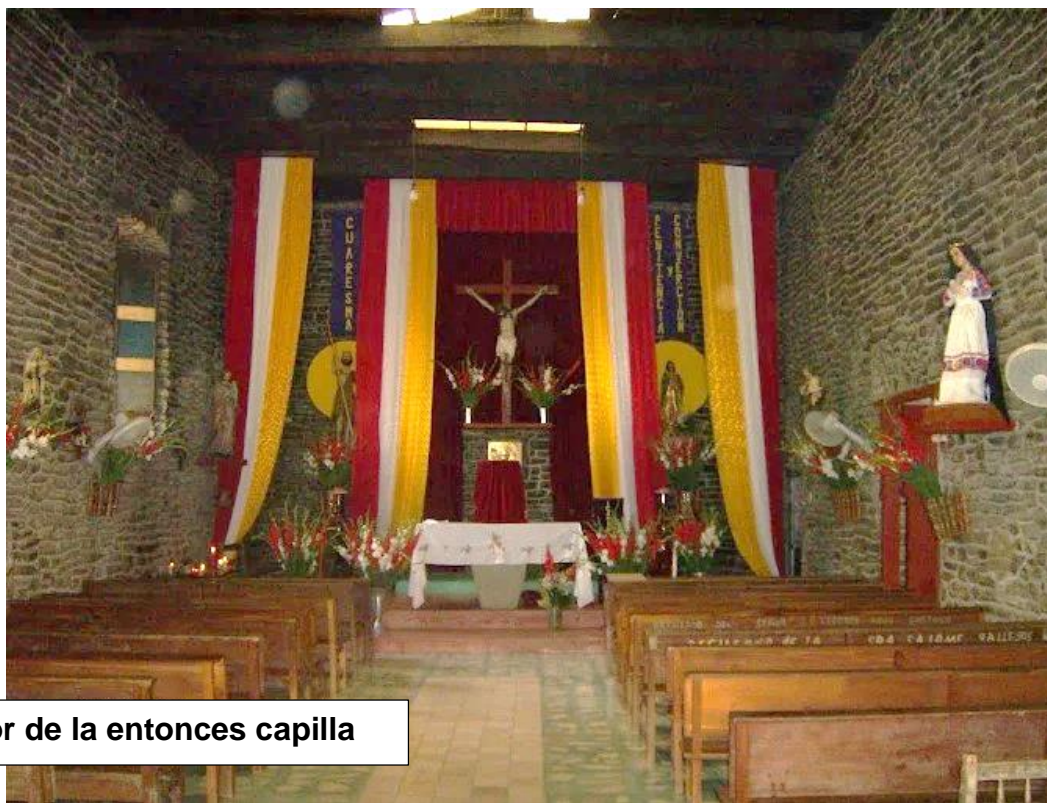
Interior de la entonces capilla