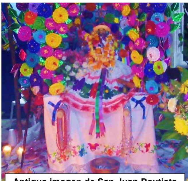
Antigua imagen de San Juan Bautista