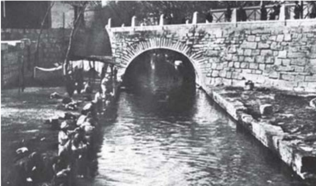
Imagen: Puente Benito Juárez situado en la calle Zaragoza cruzando los ojos de agua de Santa Lucía.

En ese discurso emitido en la sede de la masonería 4 en su condición como gran maestro de la logia, hace referencia con elevada emotividad al también masón Benito Juárez: